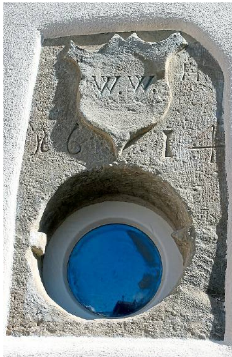
... erhalten geblieben.