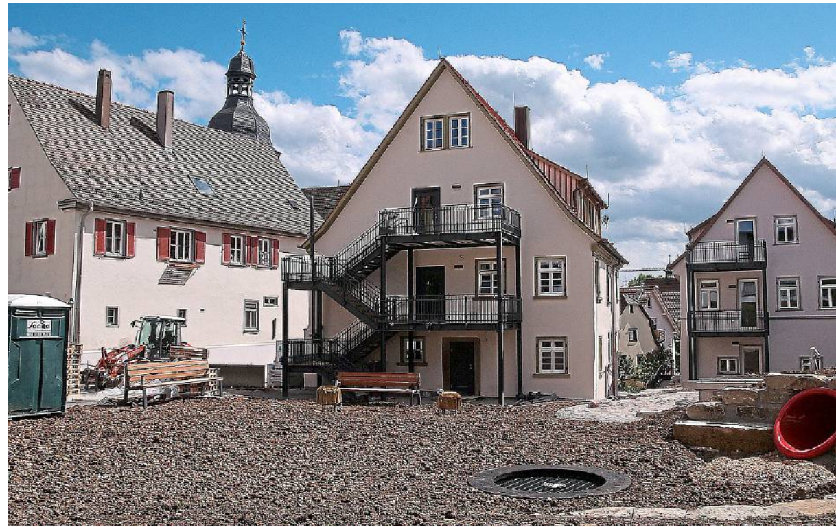
Blick vom Bürgergarten, der derzeit noch umgestaltet wird, auf die Rückansicht von Bürgerhaus (Mitte) und Alter Schule (rechts).