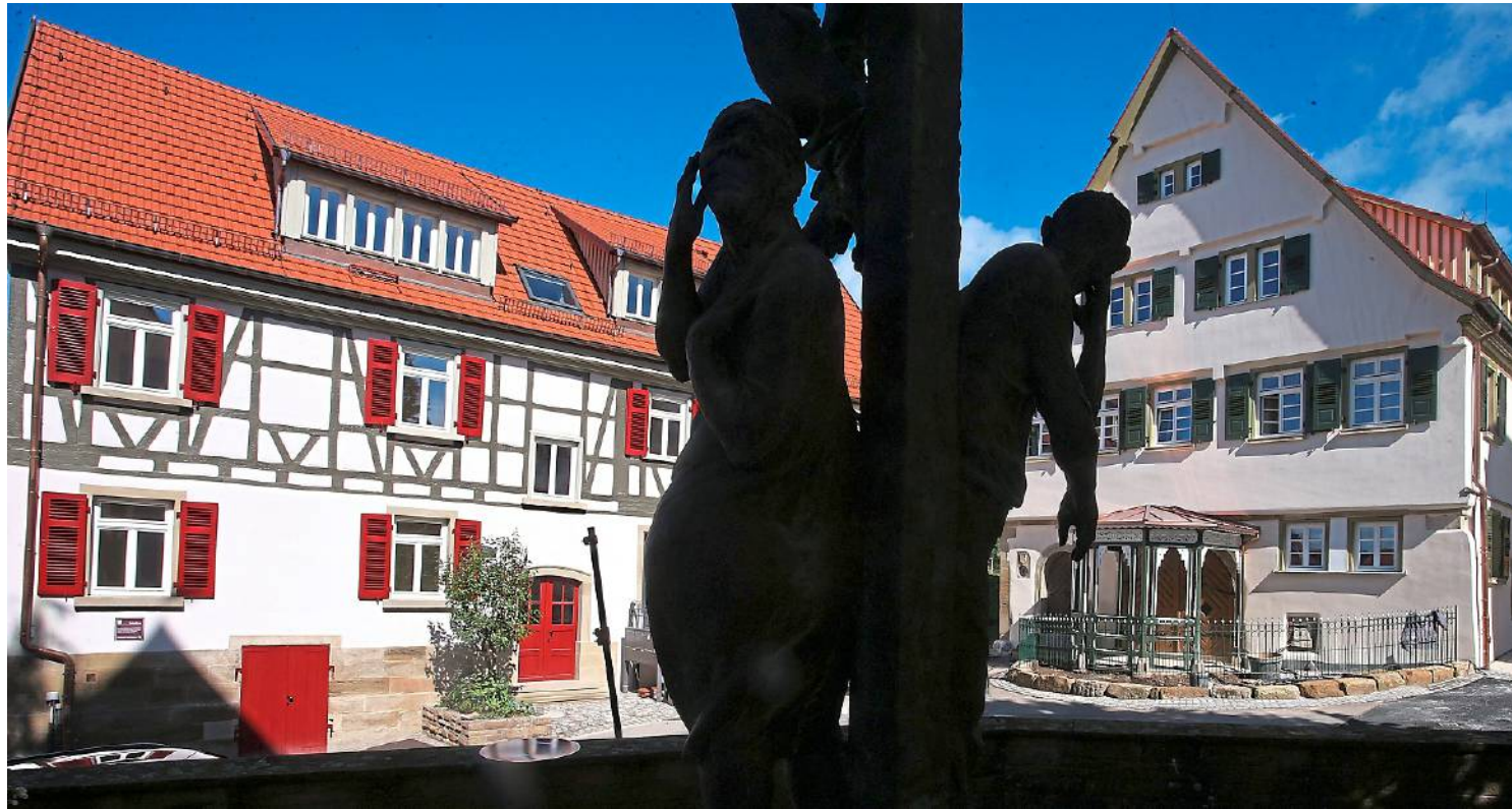
Die Alte Schule (links) und das Bürgerhaus am Kirchplatz in Löchgau.